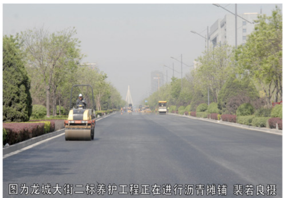
图为龙城大街二标养护工程正在进行沥青摊铺

4月30日，由三公司承建的龙城大街二标养护工程历时十六天，优质高效地完成了养护任务。全体施工人员以“开局就是决战、起步就是冲刺”的豪情壮志，用智慧和汗水托起龙城标志性道路的养护任务，再一次为美丽太原建设增辉添彩。